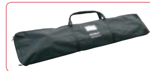
Bolsa de transporte incluida.

Soporte Telescópico XL A PARTIR DE € SIN I.V.A. 149,00