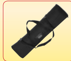
Suministrado con bolsa de transporte.