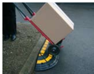
Fácil acceso para carros

Medidas (L x l): 1 920 x 360 x 150 mm o 1 320 x 360 x 150 mm. Peso: 16 kg.