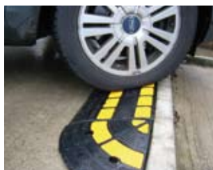
Acceso seguro para cargas pesadas