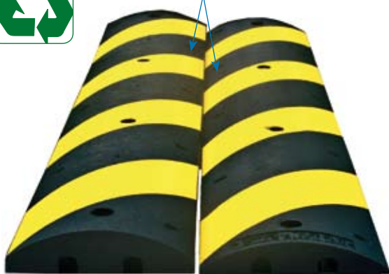
Versión camiones 15 km/h