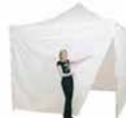
Pop-Up Pared standard