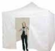
Pop-Up completa (4 paredes)