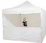
Pop-Up con media pared