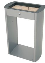
Cenicero arenero Sahara con rejilla limpieza de arena