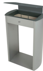
Cenicero arenero Sahara con techado