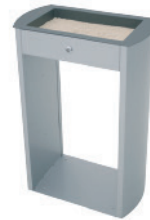
Cenicero arenero Sahara