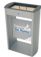
Cenicero arenero Sahara con soporte de publicidad