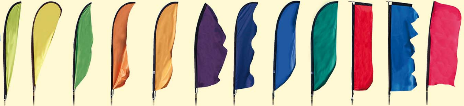
Event flags estrechos

Nuevas formas Nuevas medidas Para más impacto !