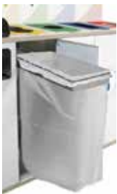
Aro Sujetabolsas extraíble