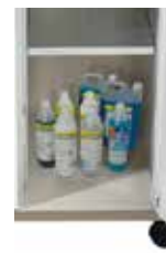
Compartimento productos limpieza *solo en versión líquidos