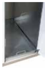
Bandeja de retención líquidos